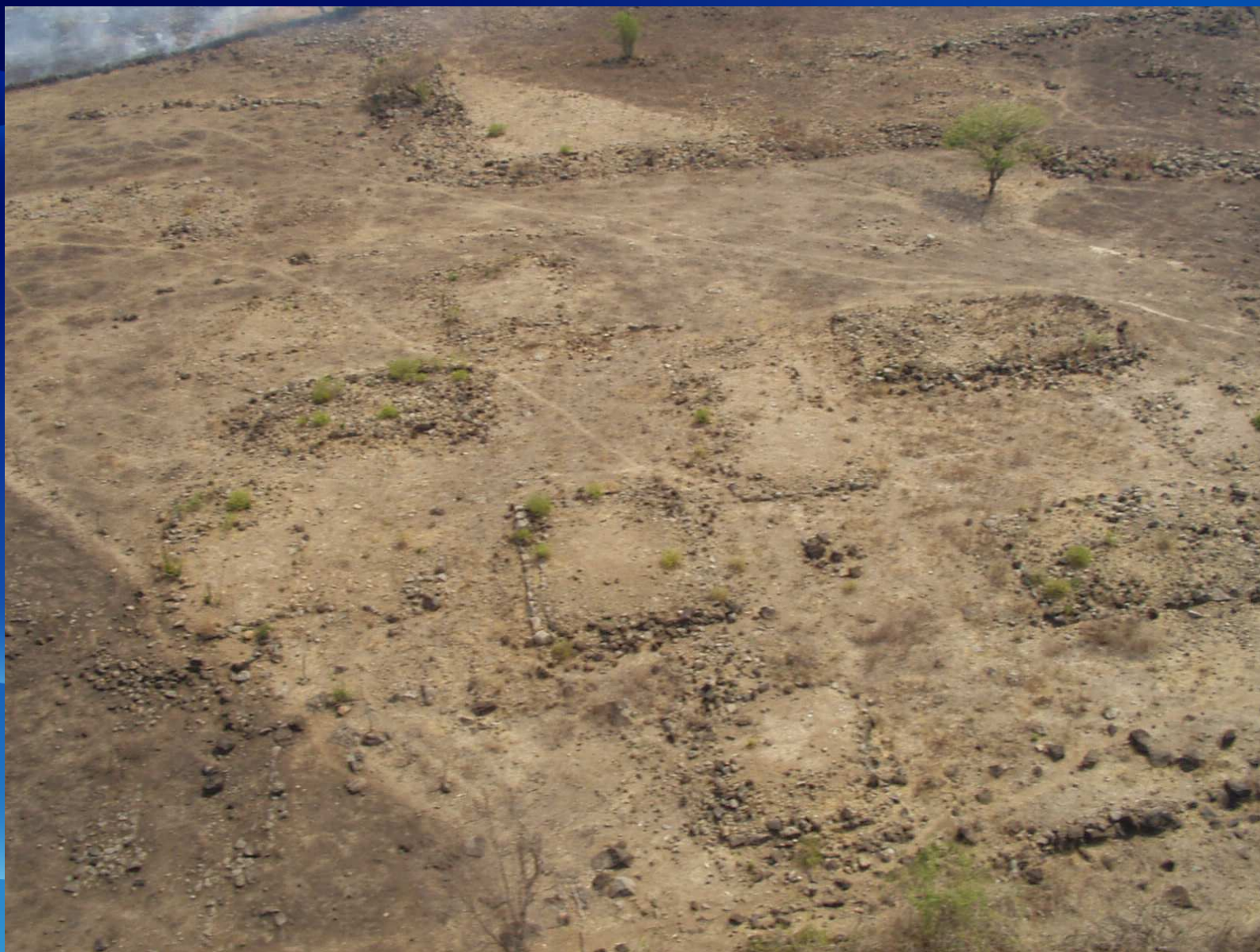
Plataforma densas, vista aerea Las Marias